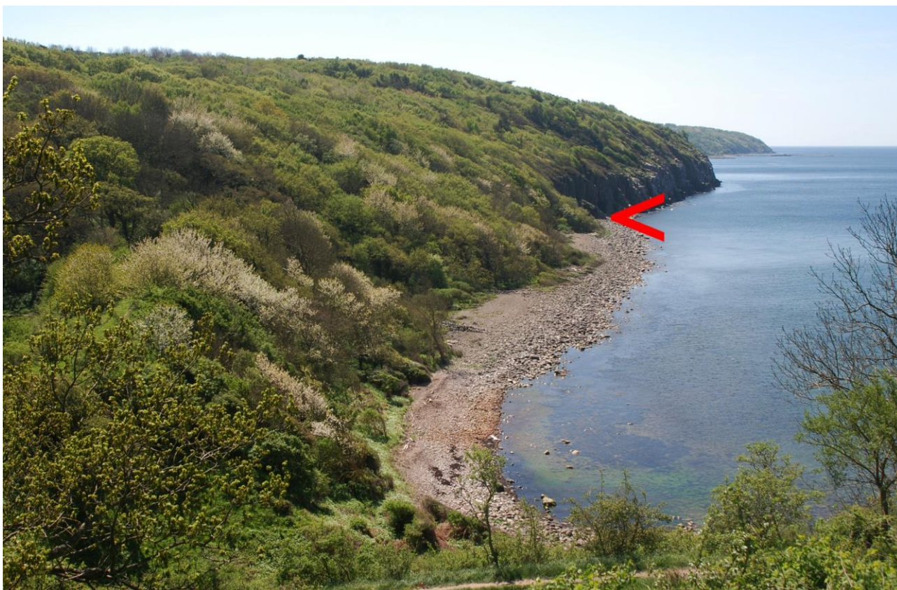
Møllevigen afsluttes i "Paradiset", hvor rullestenstranden længst mod syd afsluttes i de stejle fuglefjælde.

Naturhistorisk Forening for Bornholm og DN Bornholm inviterede søndag formiddag den 13. maj til en ekskursion med temaet indikatorer for naturskov i Møllevigen.