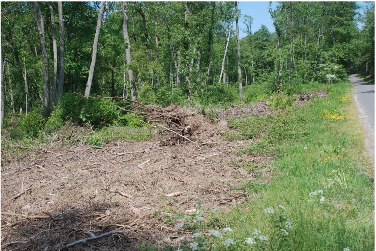
Fældningen af Skovfyr og Rødel langs Udegårdsvej – det ser ikke pænt ud.

Denne skovningsform er man for længst gået bort fra, når det gælder større skovarealer, og da Fredningsnævnet i sit svar fra marts 2015 netop bifalder nutidens metoder for tynding og DNBornholm ligeledes går ind for denne skovningsform, dog med stor hensyntagen til ældre træruiner og redepladser for hulerugere, reterer blot det visuelle under og nogle år efter en skovning: Det ser ikke pænt ud!