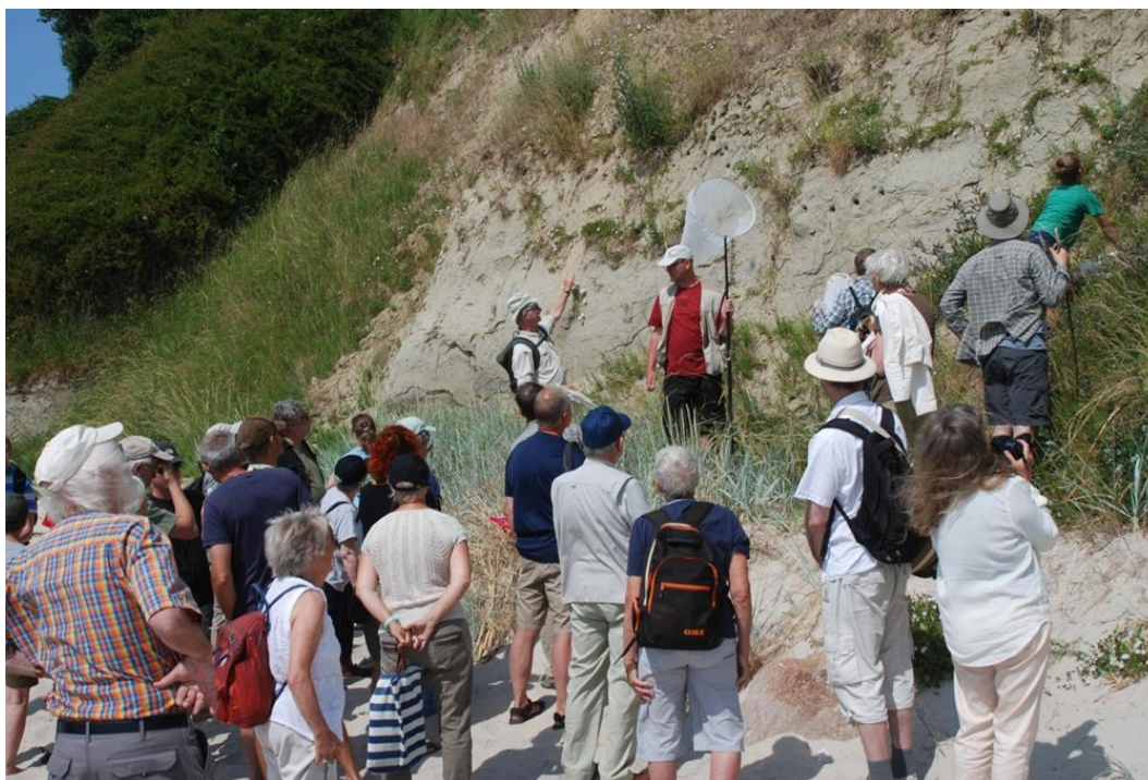
Kystprofilen øst for Arnager er landets eneste levested for Pragtvægbi.

På kystskrænterne udenfor var det derimod i høj grad specialiteterne, der gjorde ekskursionen til en tur, man vil huske meget længe: Pragtvægbi Anthophora aestivalis har landets eneste forekomst i den blottede skrænt umiddelbart øst for Arnager, hvor den lever sammen med de mere almindeligt forekommende Træborende Bladskærerbi og Metalsmalbi.