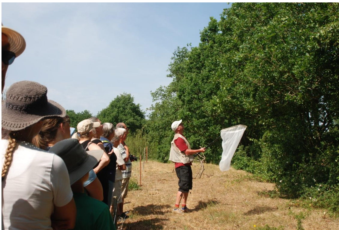
Vegetationen var svedet af, og kun få blomsterkunne tiltrække bier, der i stedet skulle findes i trækrønerne

Ekskursionen, der blev besøgt af mere end 35 medlemmer, blev afviklet på kyststrækningen mellem Madsegrav og Arnager, først oven over kystskrænten på det fredede strandoverdrev i retning mod Arnager og derefter langs kystskrænterne retur til Madsegrav.