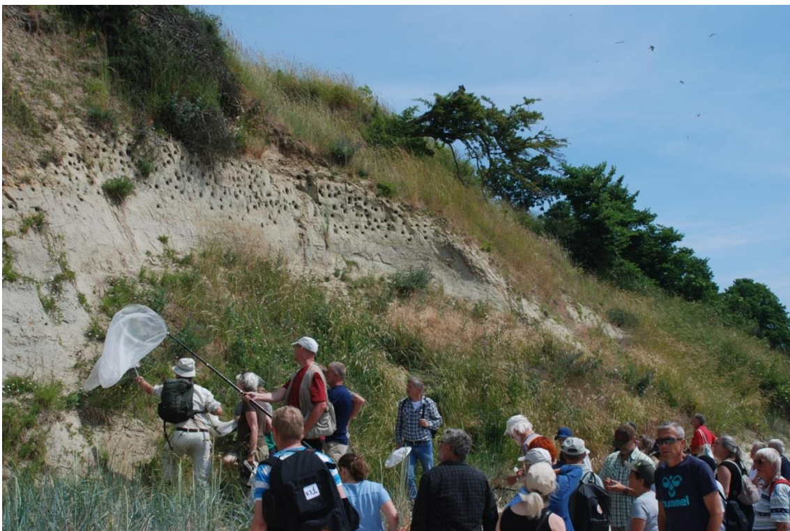
Ikke mange deltagere var på forhånd orienteret om kystskræntens nationale vigtighed for de vilde bier

Med udsigten til kommende kraftige storme og højere vandstand i farvandet omkring Bornholm må det forventes, at der også andre steder på den bløde stejlkyst fra Stampen til Boderne vil kunne opstå lignende egnede lokaliteter for denne – og andre endnu ikke registrerede arter.