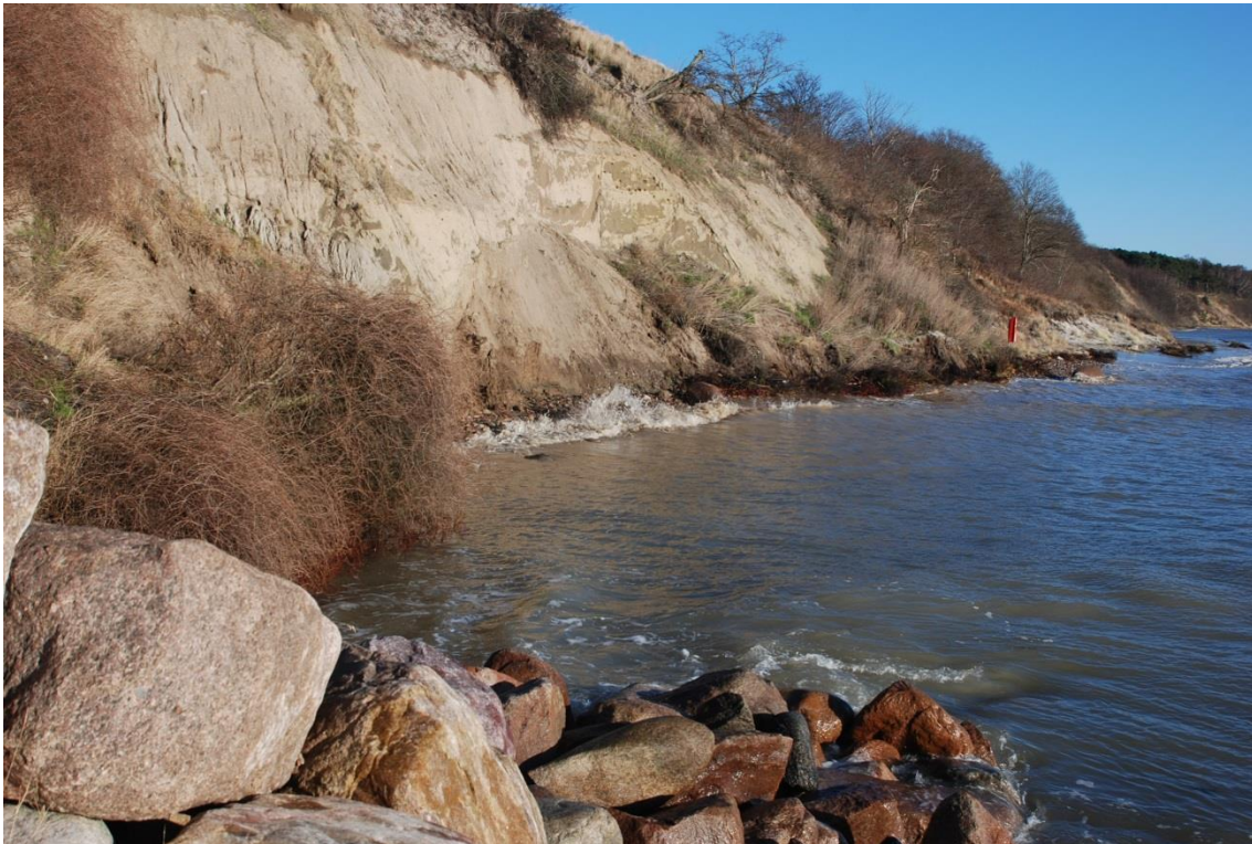
Kystskrænten umiddelbart øst for Arnager er under aktiv nedbrydning ved højvande og vestenstorm

Pragtvægbi har fundet sig tilrette i en kystskrænt, der er under aktiv nedbrydning på grund af en "uhensigtsmæssig" sikring af et par sommerhuse med marksten.