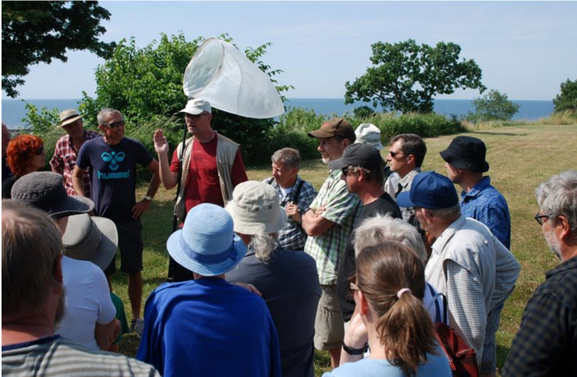
Spørgelysten var stor blandt deltagerne

For som det blev fremhævet: ”Flere af de vilde bier har det svært, og der er brug for en fælles indsats, så udviklingen bliver vendt. En sund og mangfoldig bestand af bier bidrager ikke kun til en rig natur, men også til at sikre den værdifulde bestøvning af mange af vores landbrugsafgrøder”.