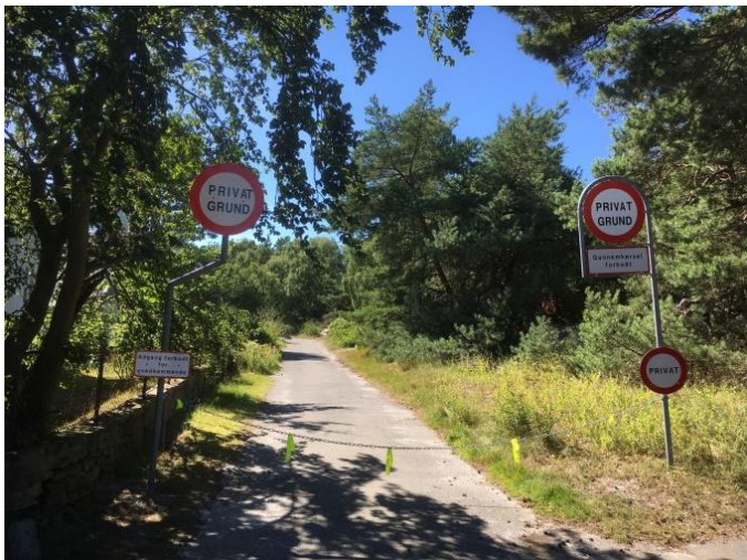
Den ulovlige skiltning ved Fyrvejen

Desværre er spærringen af den gamle adgangsvej ved Dueodde Fyr stadig aktuel. Den er kun eskaleret, efter at ejeren fik påbud om at fjerne de ulovlige skilte. Vejen blev efterfølgende fysisk spærret. Hele sagen varetages nu af kommunen som tilsynsmyndighed, og overtrædelserne er meldt til politiet. Vi håber meget på, at sagen fører til en genåbning af adgangen ad den gamle vej. Det vil være rigtig skidt for adgangen i det åbne land, hvis en ejer, der blæser på regler og tradition, kan få held til at blokere denne adgang uden konsekvenser.