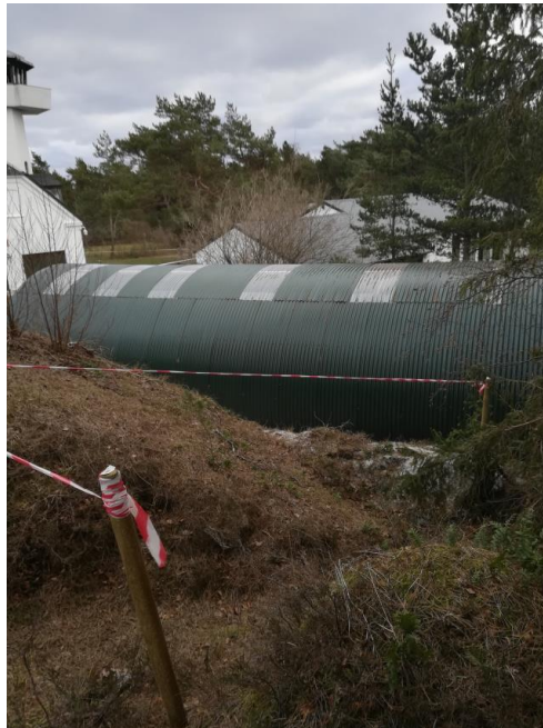
Nedlæggelse af Fyrvej og stien, afgravning af terræn. Tilførsel af materiale.