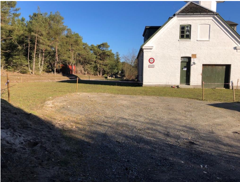
Dette og ovenstående foto: Bygningen med det gamle fyrtårn set fra vest. Her gik Fyrvejen og redningsstien. Nu er skrænten gravet af, der er tilført materiale, sået græs og spærret af.