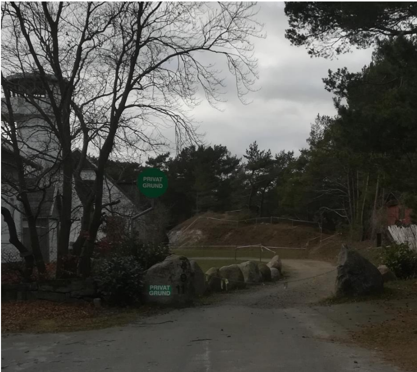
Fyrvejen ved indkørsel. Rester af den offentlige sti der nu er spærret/bortgravet.