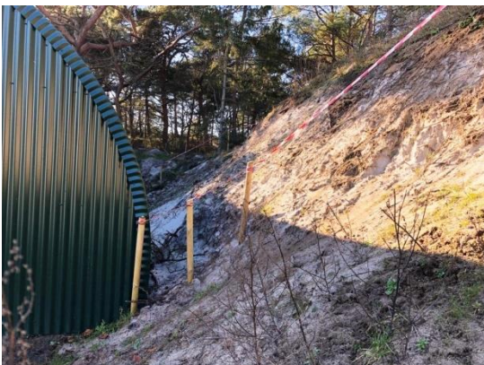
Terrænændringer i klitområdet.