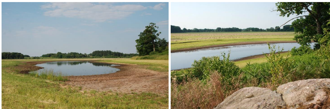
Lavning øst for Egeholmen er ved at miste vandet 19. juni 2021 – her hørtes løvfrø kvække 5. juni 2021

Og det var i bund og grund ekskursionslederens ultimative ønske for turen, at blive bekræftet i, at netop løvfrøen allerede her mindre end et år efter etableringen af vandsamlingerne har kunnet finde vej ud i det nyskabte naturområde.