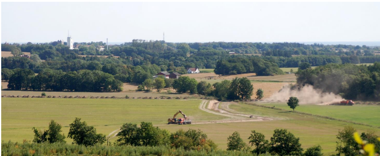
Det rørlagte vandløb bliver genskabt som åben grøft – som i "gamle dage"

Med store maskiner blev det gamle forløb af Læsåen i august 2020 genåbnet på 1270 meter, genskabt et nyt nordligt og et sydligt tilløb fra landkanalen.