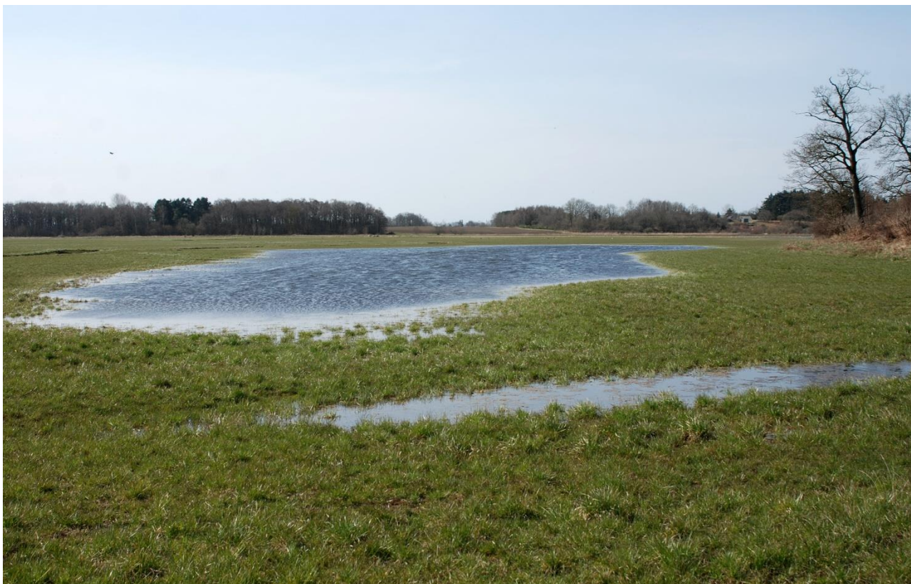
Lavning øst for Egeholmen fyldt med vand 17. april 2021 – et godt sted for frøer og vadefugle

I alt blev der flyttet 7.460 kubikmeter jord, etableret fem overkørsler samt lagt gydegrus ud til de havørreder, der må forventes at nå frem til Vallenskæret i de kommende gydesæsoner!